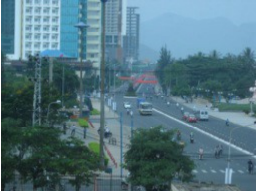
ベトナム・ニャチャンの街並み