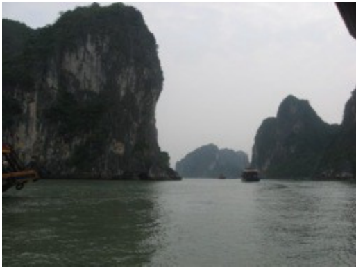
ハロン湾と言えば、奇岩