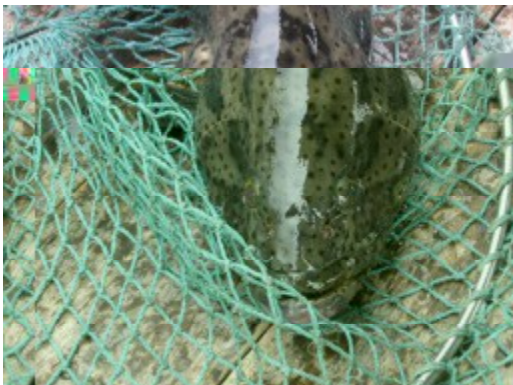
この魚は？白身で美味しいとか？