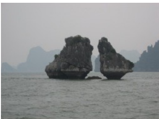
ハロン湾の象徴の岩