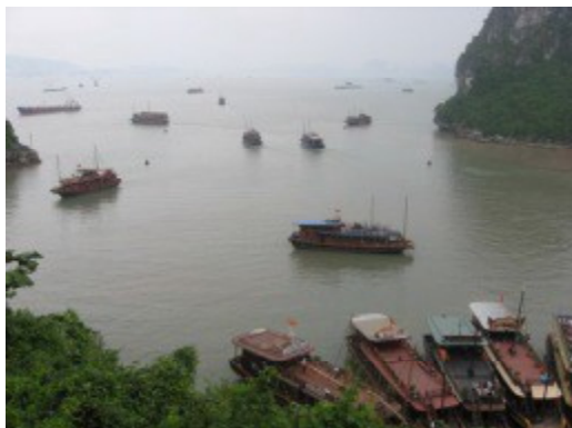
船上でのランチと洞窟ツアー付き