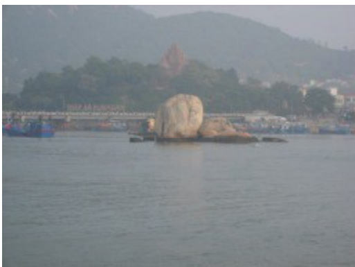
ニャチャン川河口に浮かぶなぞの石