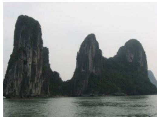
奇岩には名前があるそうです