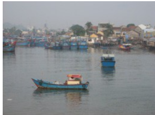
同じ色、形の船多い