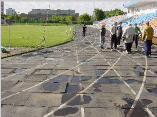
レーススタート前、トラックを見て