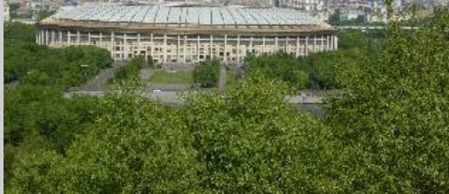
モスクワオリンピックのメインスタジアム