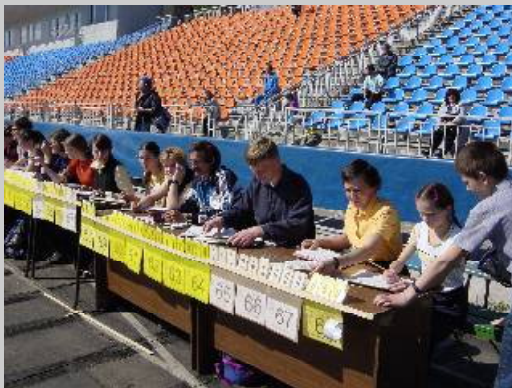
ボランティアのカウンター