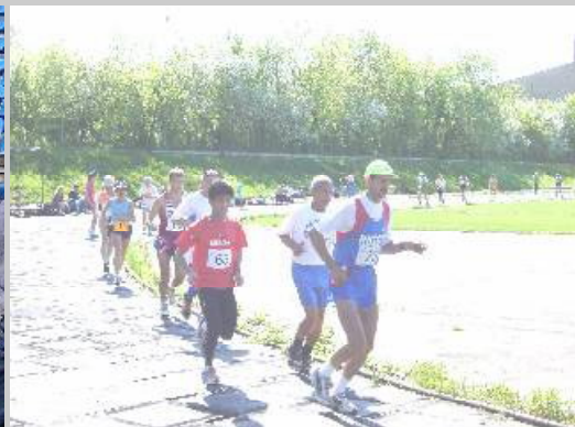
スタートしてまもなく