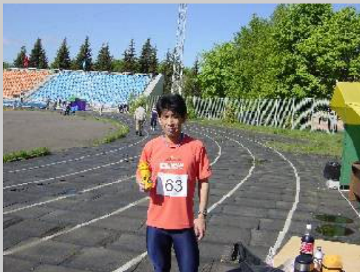
これからスタート、使用前