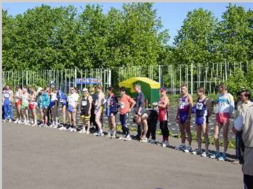
スタート前、全員集合