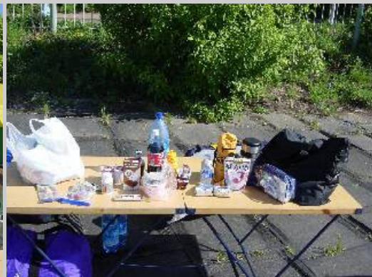
日本から持って行った食べ物