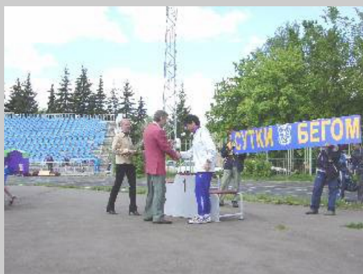
なぜか年代別1位に