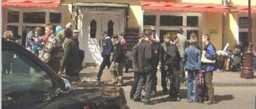
アルバート通りのマック