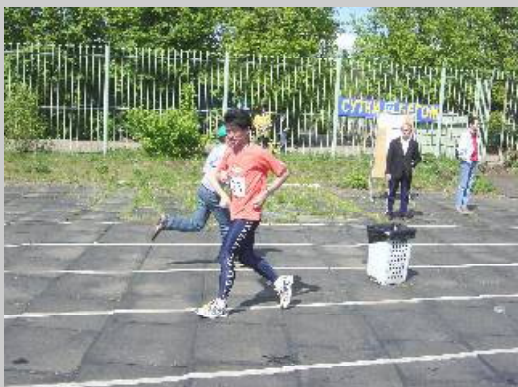
この辺が一番走りやすい