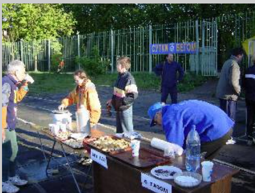
エイドステーション