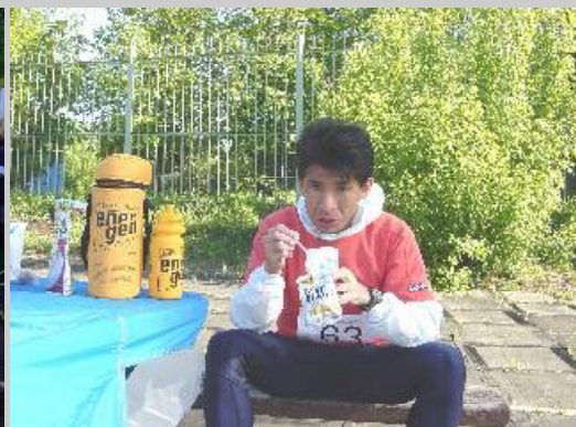
レースも後半、おかゆに味噌汁を食べる